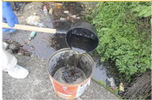
水路に溜まった重油の回収